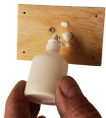
3. Naneste lepidlo na destičku s menšími dírkami