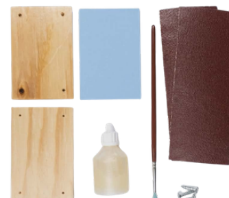
1. Nachystejte si pomůcky.

Kompletní videonávod na facebookové stránce Hravé a dřevěné