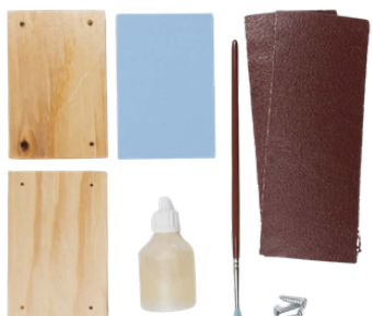
1. Nachystejte si pomůcky.

Kompletní videonávod na facebookové stránce Hravé a dřevěné