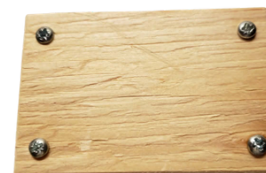
7. zašroubujte šroubky do připravených dírek.