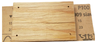
5. Busný papír položte na stůl brusnou stranou dolů, na ni položte destičku pěnovkou dolů.