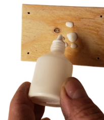
3. Naneste lepidlo na destičku s menšími dírkami