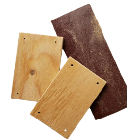
2. Obruste dřevěné části.