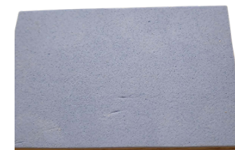
4. Nalepte pěnovku.