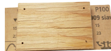
5. Busný papír položte na stůl brusnou stranou dolů, na ni položte destičku pěnovkou dolů.