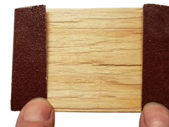
6. Ohněte silou brusný papír přes desku nahoru.