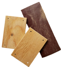
2. Obruste dřevěné části.