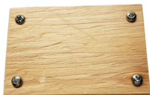
7. zašroubujte šroubky do připravených dírek.